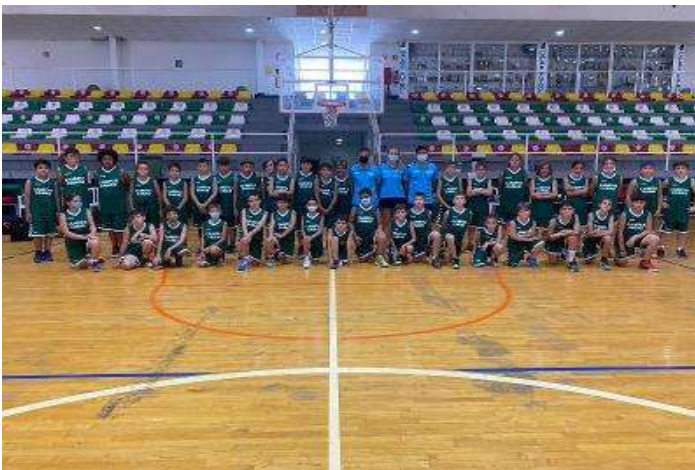
Campus de Baloncesto en Alicante