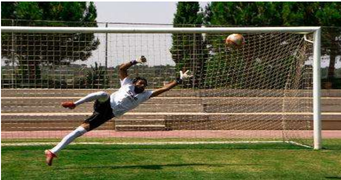
Campus Fútbol Verano Alto Rendimiento Valencia