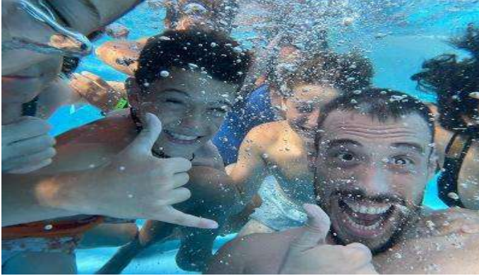
Campamento de Deportes Acuáticos en Inglés Valencia

JUVIGO BUSCADOR DE CAMPAMENTOS https://juvigo.es/ Más información: 911 238 208 (de lunes a viernes, de 9 a 18 horas) o enviar un correo electrónico a reservas@juvigo.es